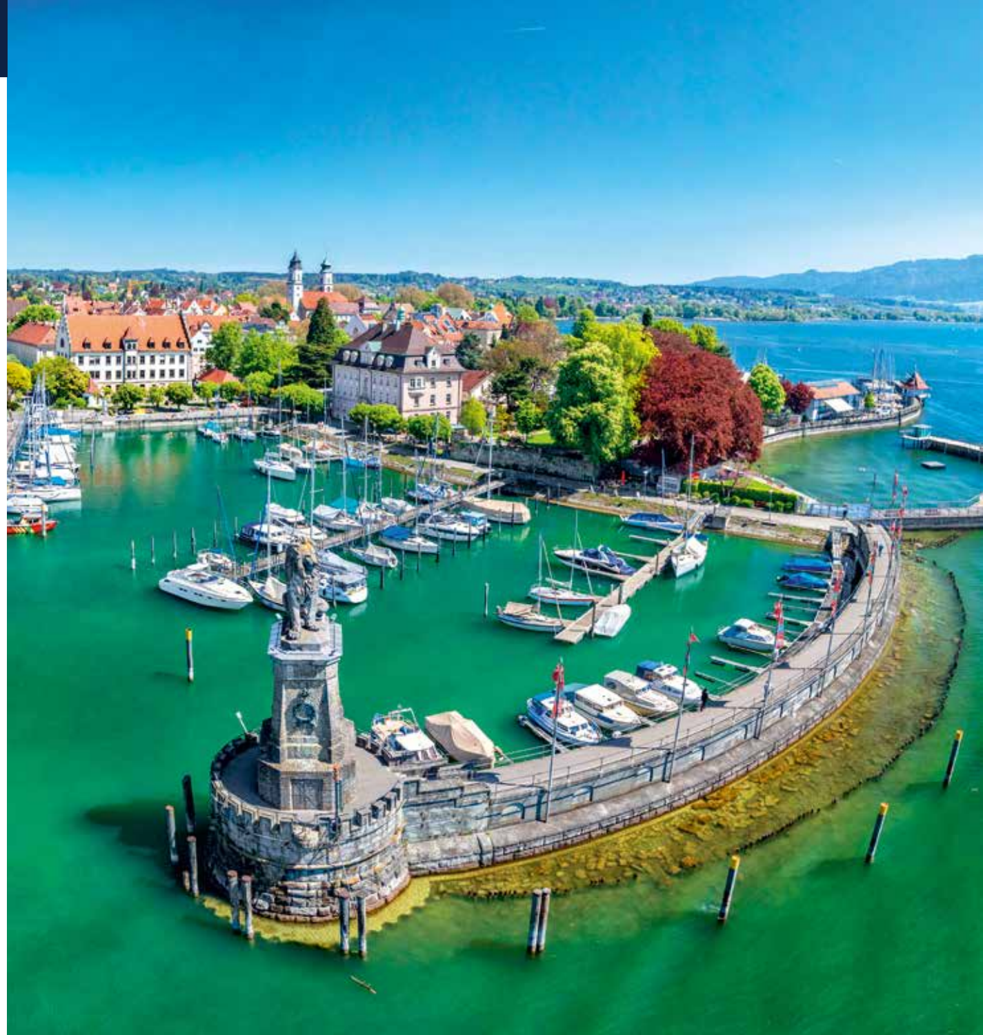
Die Hafeneinfahrt von Lindau gilt als die schönste am ganzen Bodensee

Die Altstadt liegt auf einer knapp 70 Hektar großen Insel im Bodensee. Mit ihren jahrhundertealten Gebäuden, lebhaften Plätzen und malerischen Gassen versprüht sie Bodenseeflair. Hinter der weitbekannten Hafeneinfahrt mit bayerischem Löwen und weißem Leuchtturm eröffnet sich das beeindruckende Alpen- und Bodenseepanorama. An der Uferpromenade, die als die schönste am Bodensee gilt, lässt sich von einem der zahlreichen Cafés aus hervorragend das maritime Treiben im Hafen verfolgen.