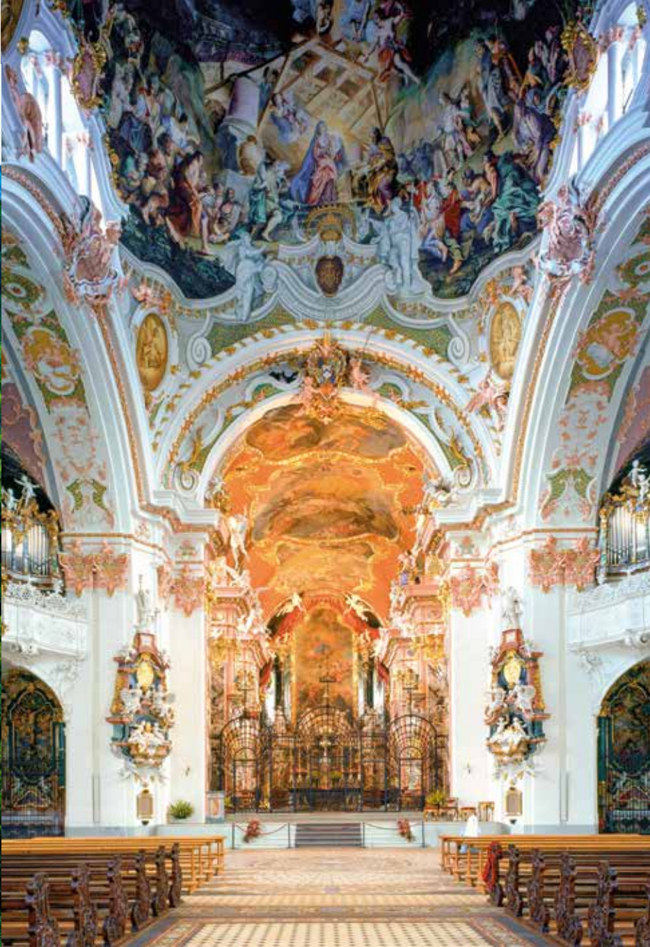
Einer der bedeutendsten Wallfahrtsorte in Europa