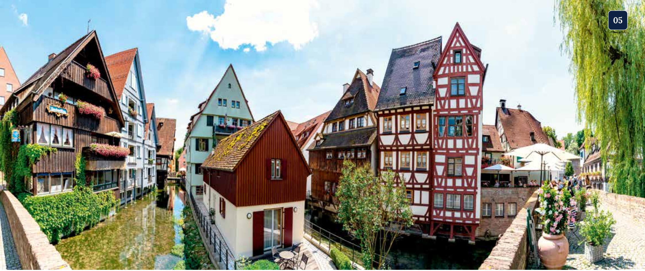
Das Fischerviertel in Ulm liegt an den Kanälen der Blau – mit seinen idyllischen Fachwerkhäusern bildet es eine schicke Altstadtperle