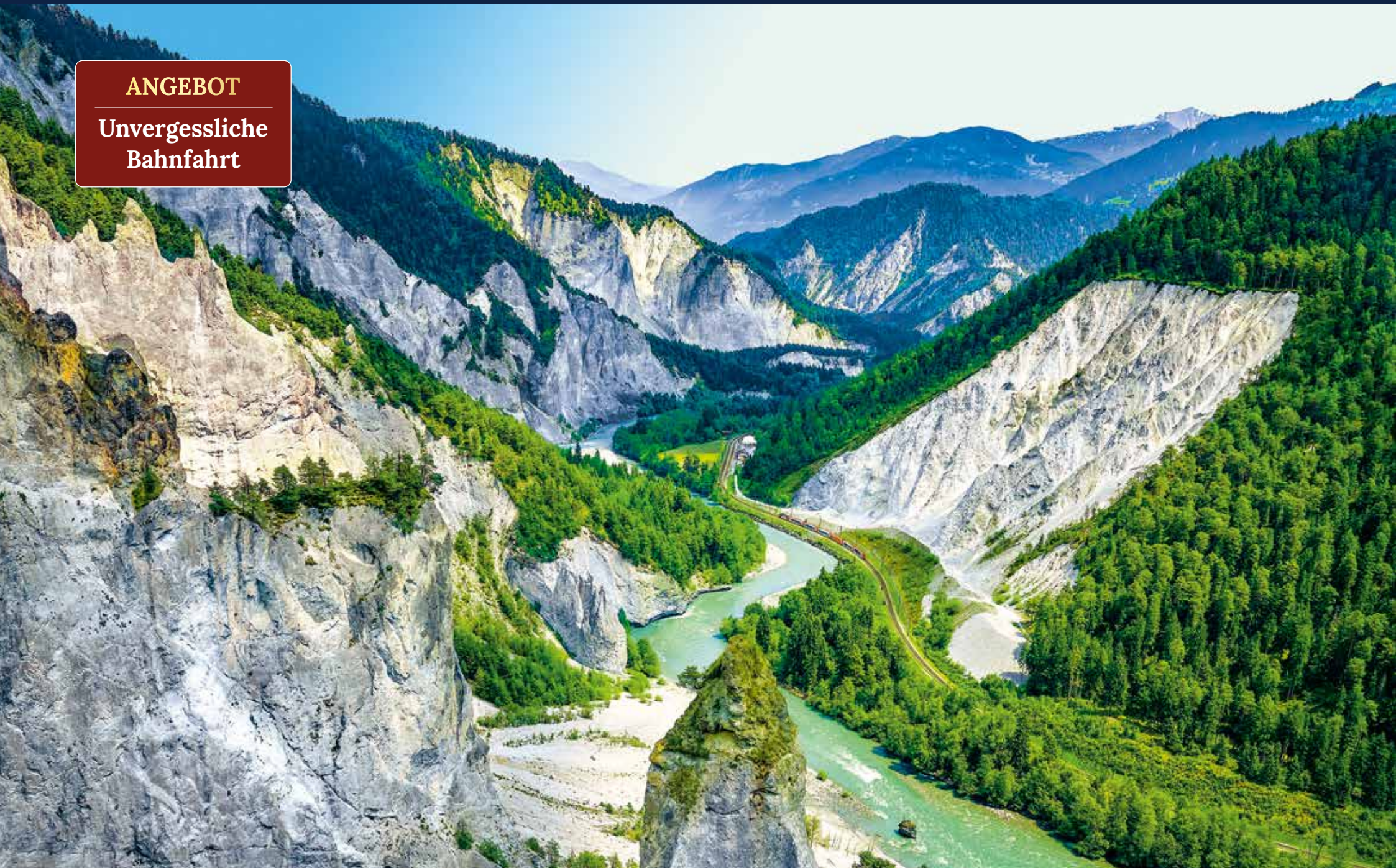
Die Rheinschlucht gehört zu den wohl einzigartigsten Landschaften der Schweiz