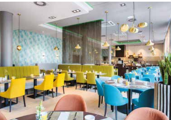
Modernes Restaurant im Hotel „Leonardo Royal“