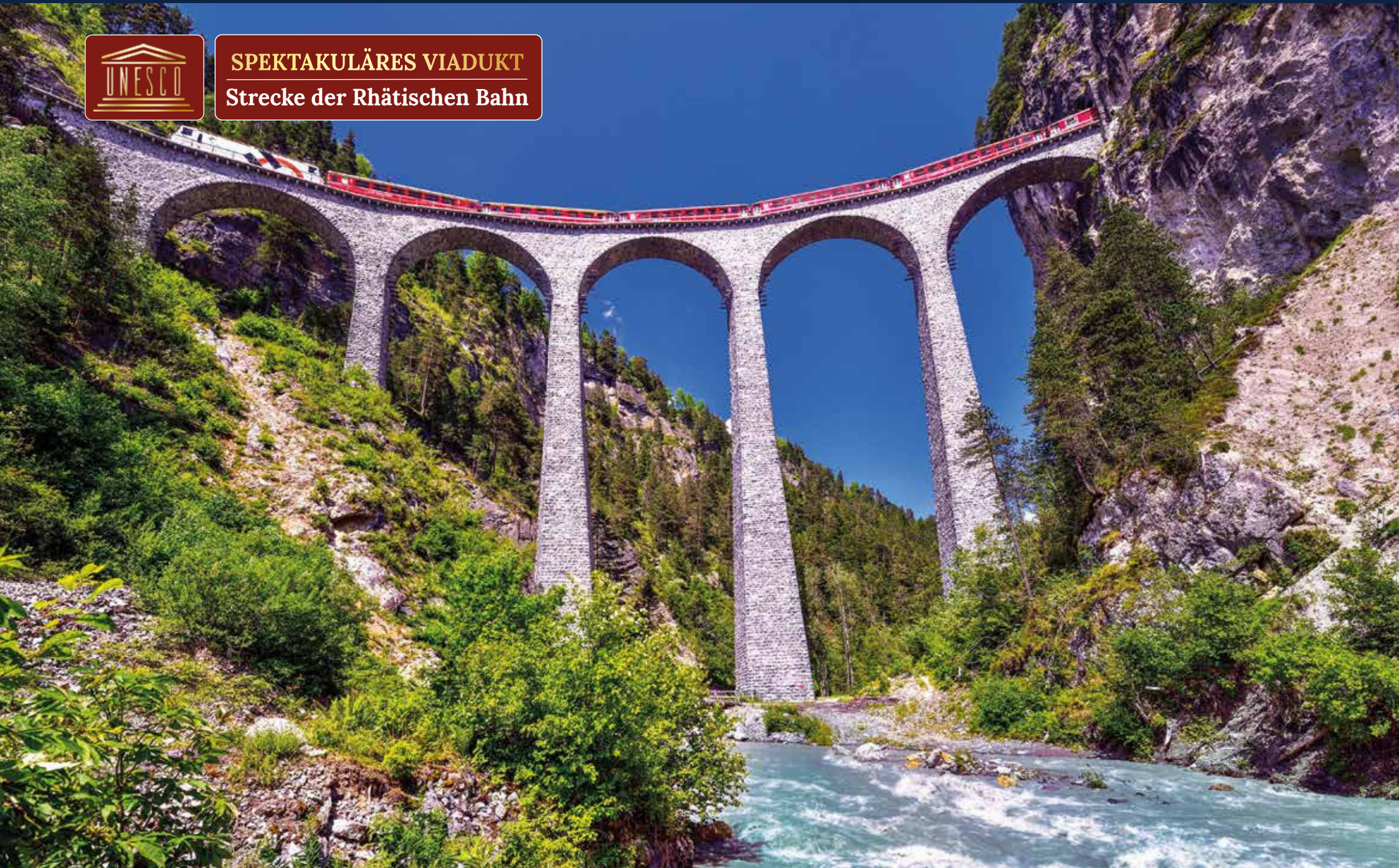
Das bemerkenswerte Bauwerk besteht mit seiner eleganten Rundbogenkonstruktion und dem eindrucksvollen Verschwinden des Zuges in einer senkrechten Felswand