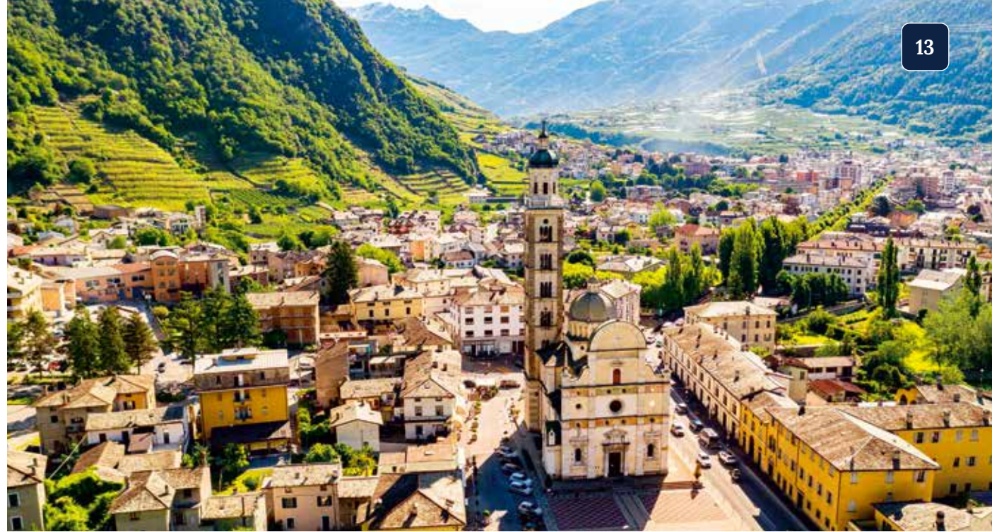
In Tirano startet unsere atemberaubende Fahrt mit dem Bernina Express

Die Albula- und Bernina-Strecke ist die höchste Bahn-Alpentransversale und gilt als eine der weltweit steilsten Schmalspurbahnstrecken ohne Zahnstange. Wir bestaunen unterwegs die faszinierende Gebirgs- welt des Morteratschgletschers, der Diavolezza oder der Lagalb. Nach jedem Tunnel und hinter jeder Kurve warten neue Höhepunkte. Nachdem wir den Lago di Poschiavo tief unten im Talgrund passiert haben, erreichen wir die Station Alp Grüm auf 2.091 Metern Höhe.