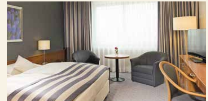
Komfortables Doppelzimmer im Hotel „Maritim“

Booking.com: „Sehr gut“, Stand: März 2026