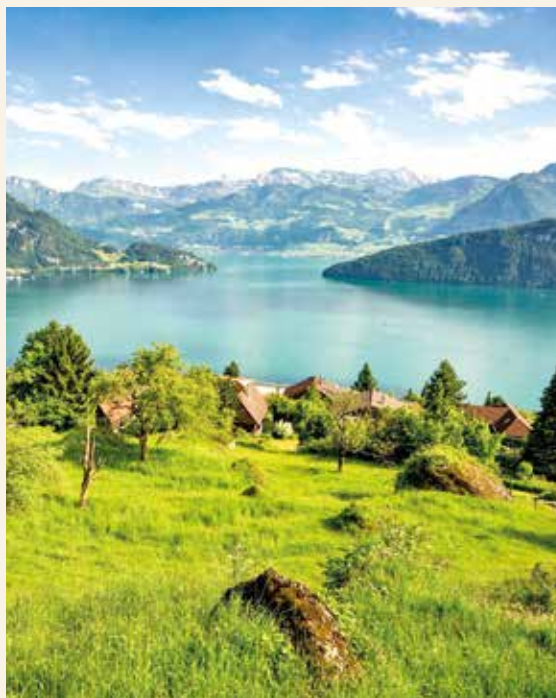
Kurze Busfahrt am Vierwaldstättersee