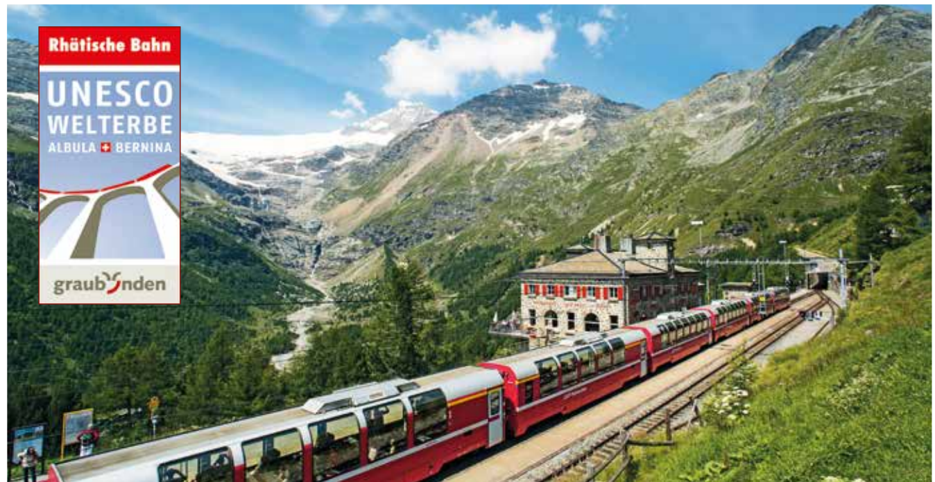
Station Alp Grüm: fantastischer Ausblick auf den mächtigen Palügletscher