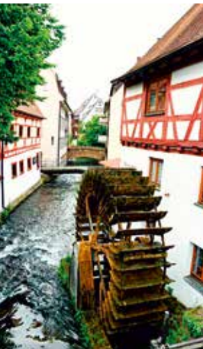
Altes Mühlensrad am Restaurant „Zur Lochmühle“

Das Restaurant befindet sich in dem ältesten erhaltenen Bau einer Mühle in der Ulmer Altstadt an der Blau. Das Mühlensrad ist das unverkennbare Wahrzeichen.