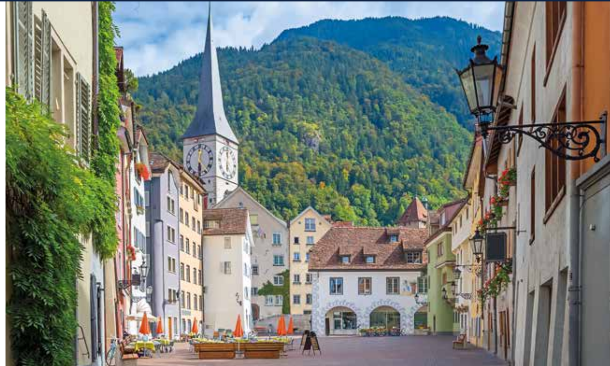
Historische Gassen und farbenfrohe Häuser in Chur vor der Bergkulisse der Bündner Alpen