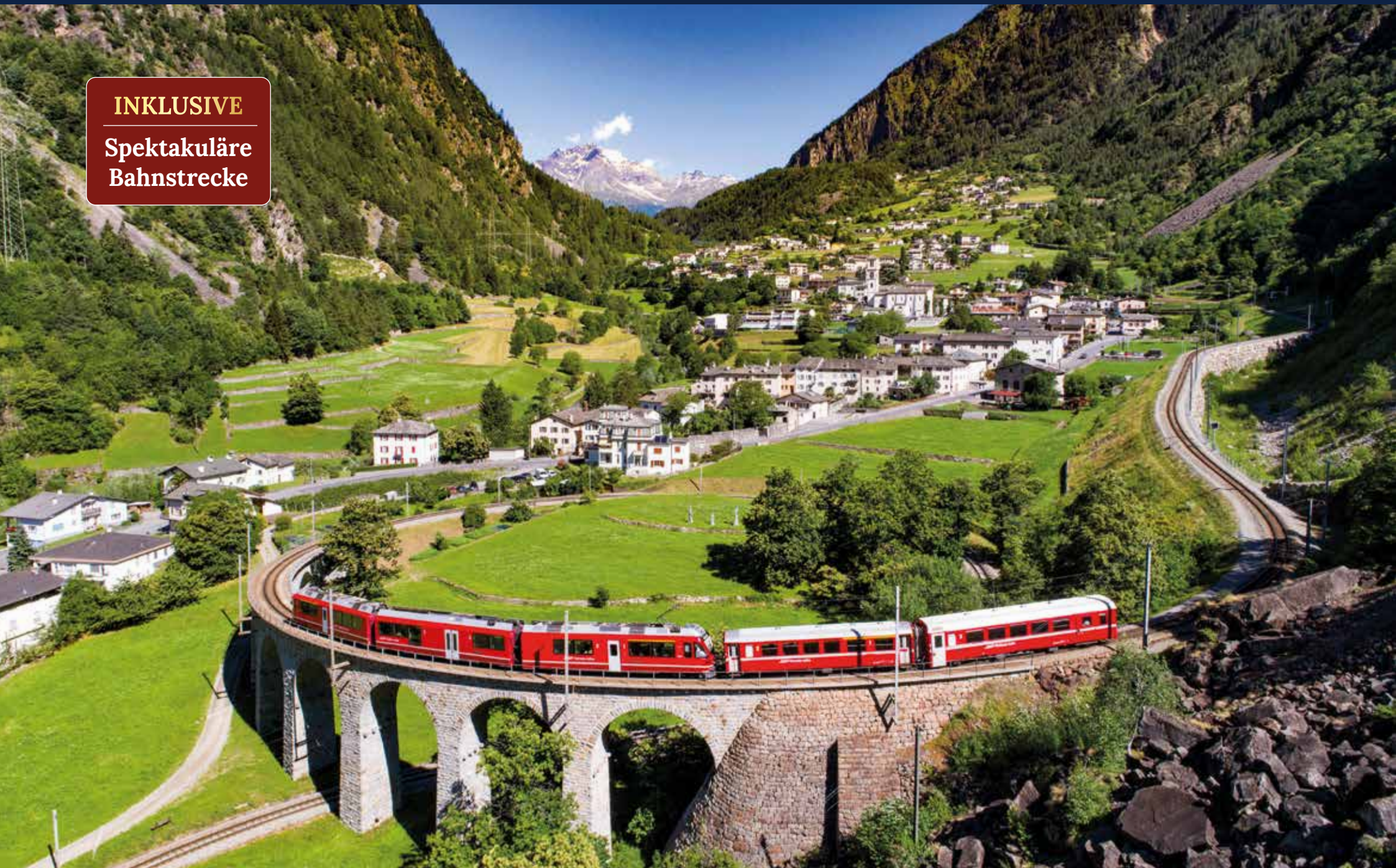
Kreisviadukt in Brusio – die Bahn fährt in einer doppelten Schlaufe von 100 Metern Durchmesser