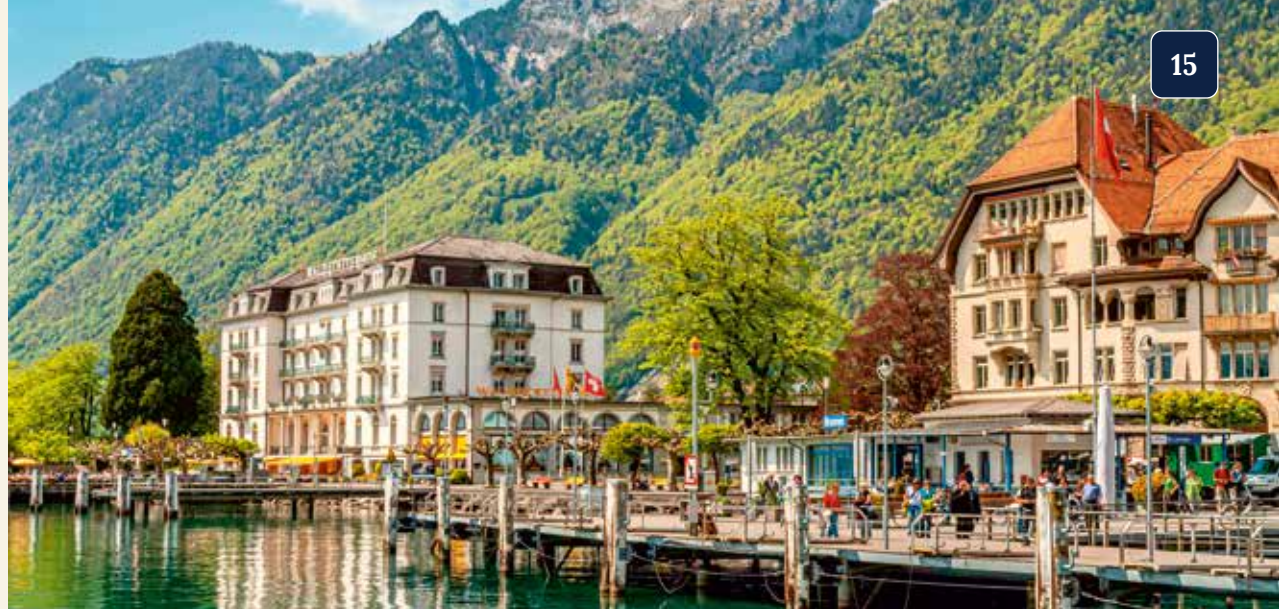
Brunnen am Vierwaldstättersee – mitten an einem der Schauplätze von Wilhelm Tell