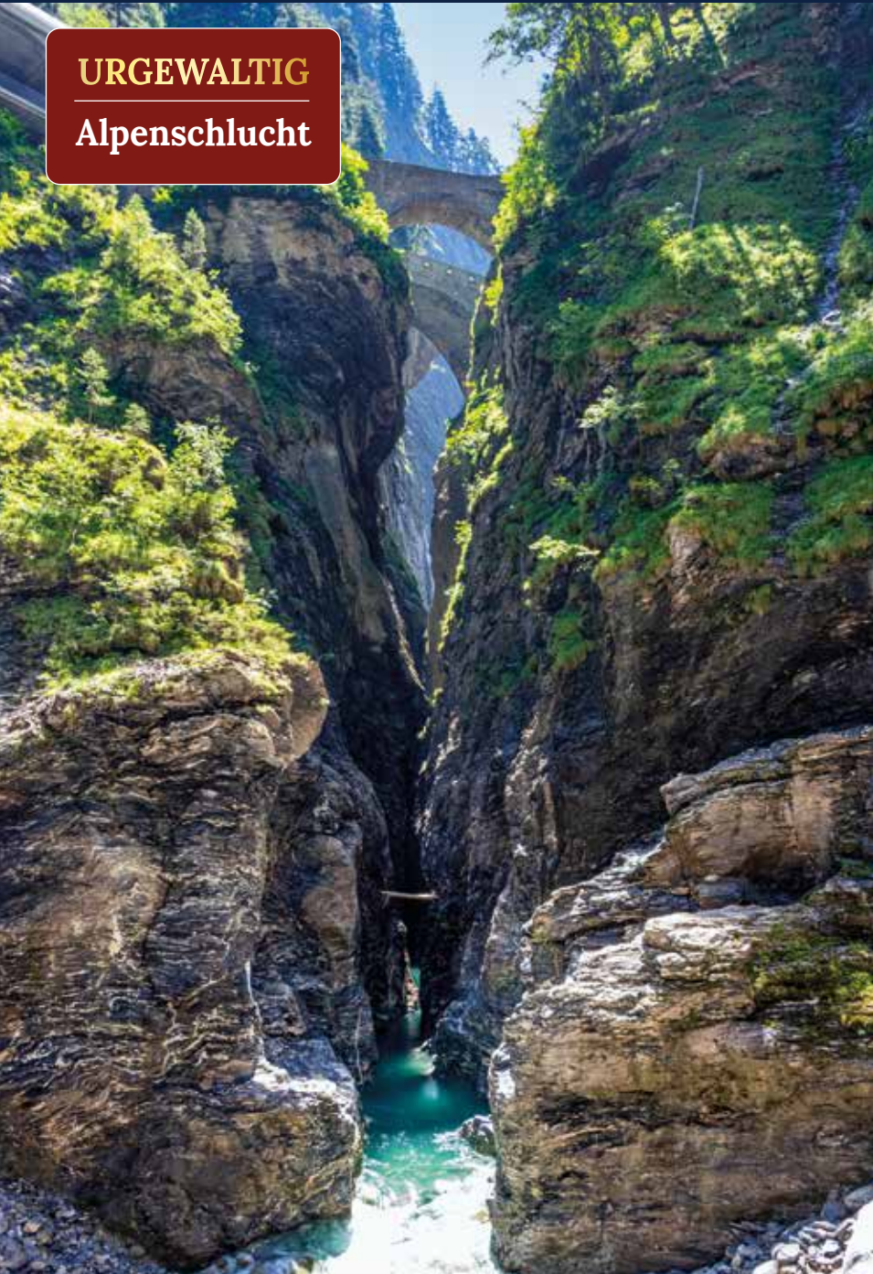
Eindrucksvolle Felslandschaft der Viamala-Schlucht