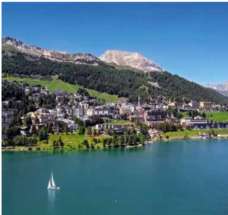
Weltbekannter Ferienort St. Moritz