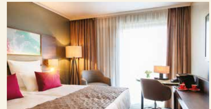
Gemütliches Zimmer im Hotel „Leonardo Royal“