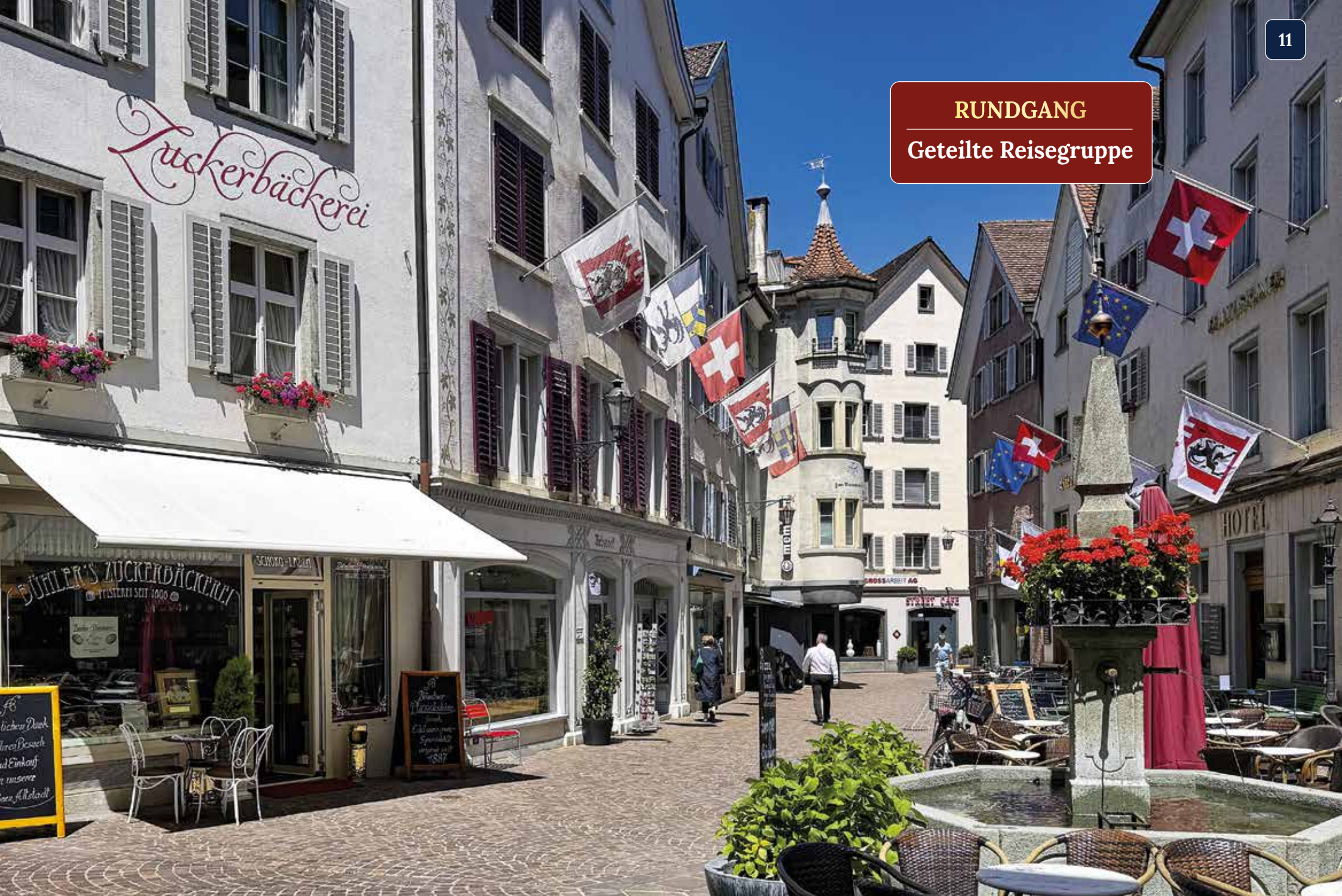
In der Altstadt von Chur verbinden sich jahrhundertealte Geschichte, verwinkelte Gassen und entspanntes Stadtleben im Herzen Graubündens