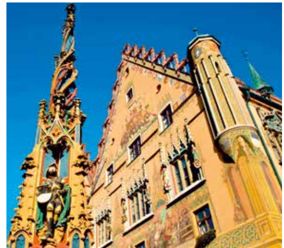
Filigran bemalte Ulmer Rathausfassade