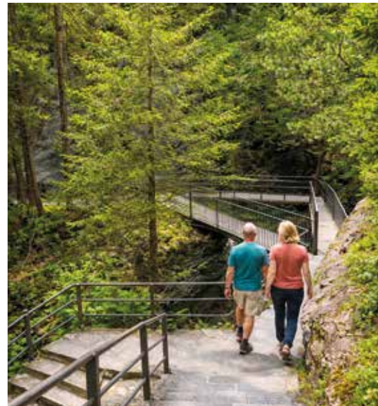
Auf sicheren Wegen in die Schlucht