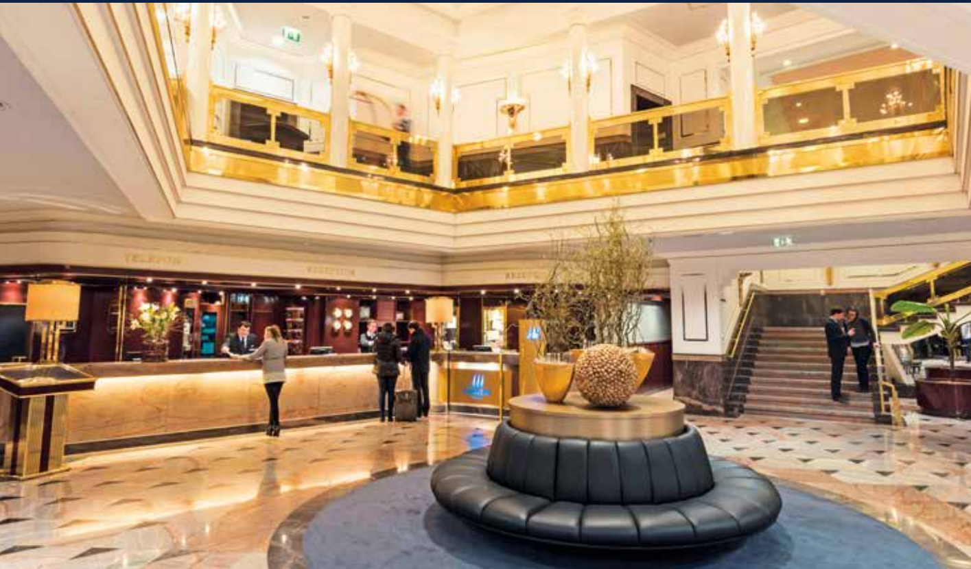
Klassisch elegante Lobby im Hotel „Maritim“