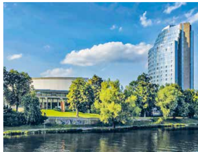
Das Hotel „Maritim“ liegt direkt am Donauufer